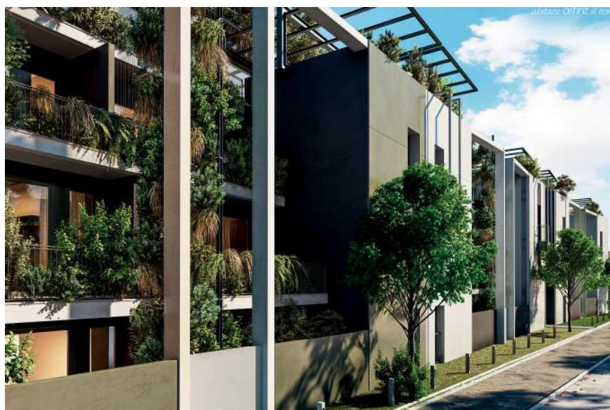
Vista Parma Santa Teresa.

I dati riportati nella presente scheda sono il risultato delle nostre esperienze ed analisi di laboratorio. Sarà comunque cura e responsabilità di chi farà uso del prodotto di accertarsi della sua compatibilità con l'impiego previsto.