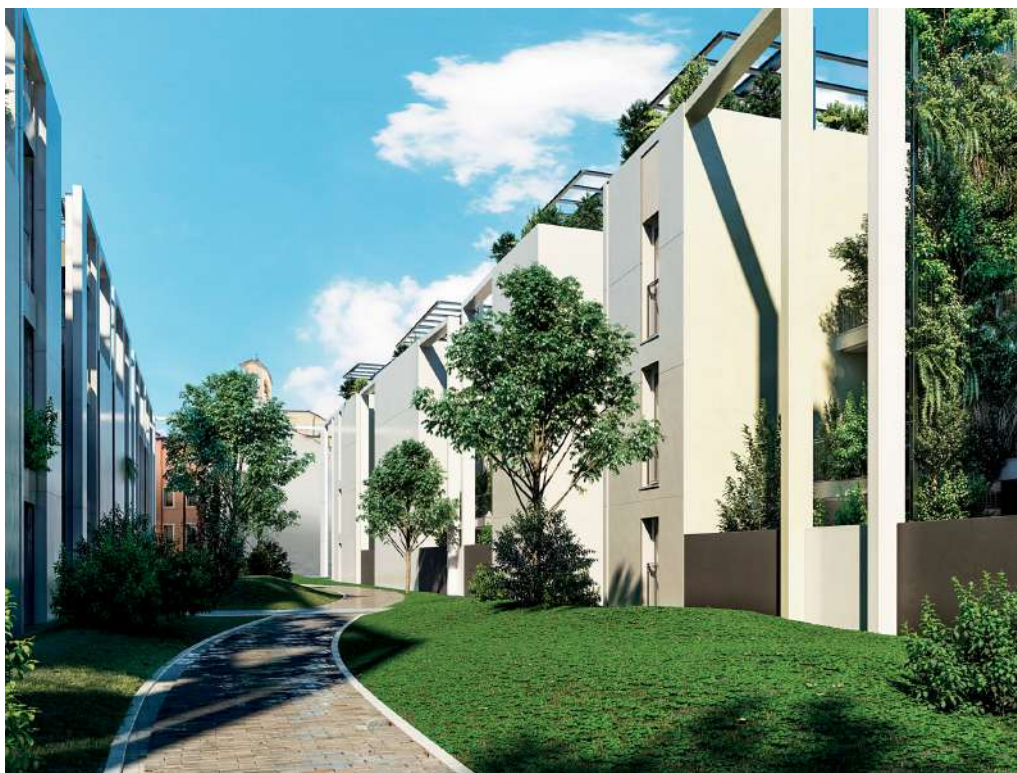
Vista Parma Santa Teresa.

I dati riportati nella presente scheda sono il risultato delle nostre esperienze ed analisi di laboratorio. Sarà comunque cura e responsabilità di chi farà uso del prodotto di accertarsi della sua compatibilità con l'impiego previsto.