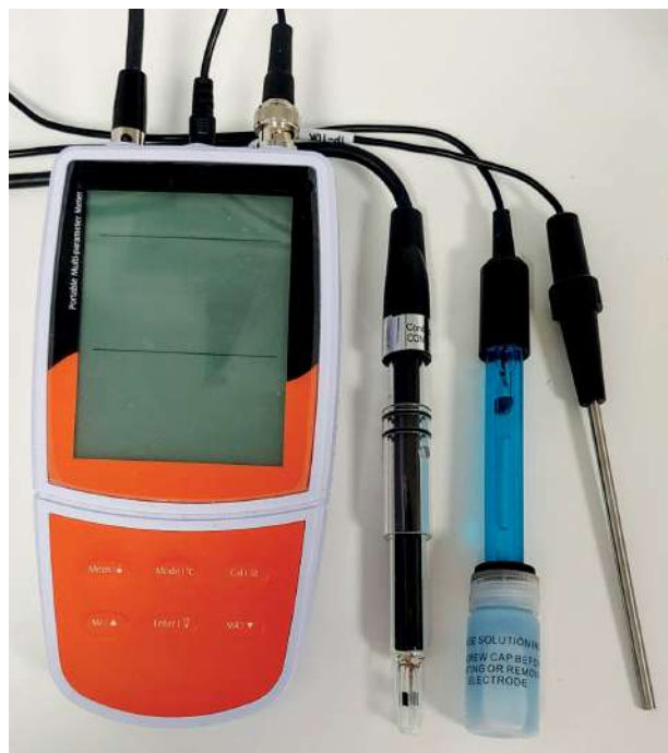
Multimetro ed elettrodi per misure di pH e conduttività elettrica.

I dati riportati nella presente scheda sono il risultato delle nostre esperienze ed analisi di laboratorio. Sarà comunque cura e responsabilità di chi farà uso del prodotto di accertarsi della sua compatibilità con l'impiego previsto.