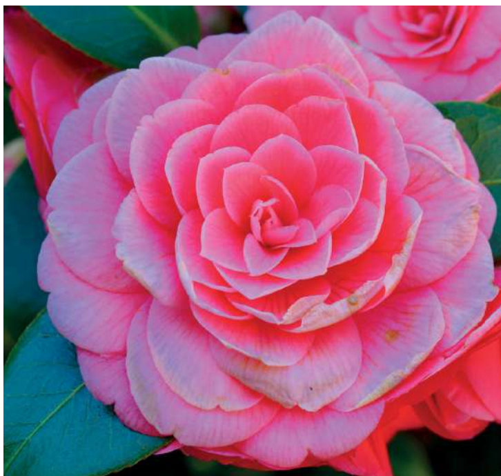
Camelia su substrato minerale sub-alcocalino.

Infine per completare il quadro relativo alla “relativizzazione” del ph, è bene tenere a mente che esistono più metodi per la sua determinazione, a seconda delle caratteristiche del terreno e delle informazioni che si vogliono raccogliere si possono utilizzare diversi approcci analitici che forniranno valori di ph alquanto variabili. In generale, per realizzare un giardino con specie con esigenze di ph diverse, si suggerisce di affidarsi ad un substrato Harpo neutro o debolmente acido come la terra Mediterranea TMLight o la terraMediterranea TMI, con l'accortezza nel posizionamento delle diverse tipologie di vegetazione.