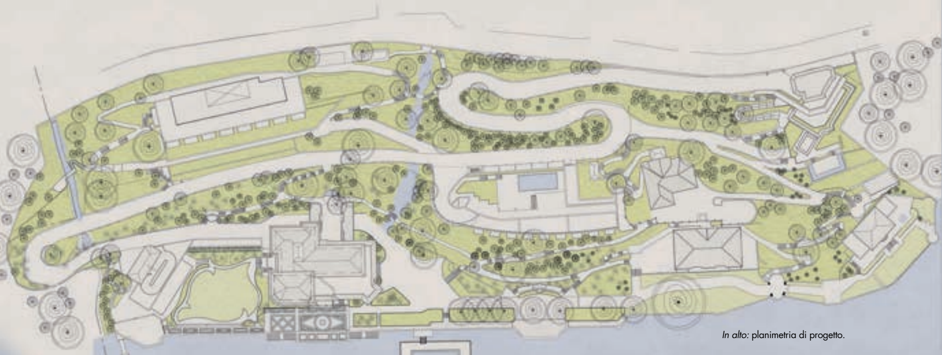
In alto: planimetria di progetto.