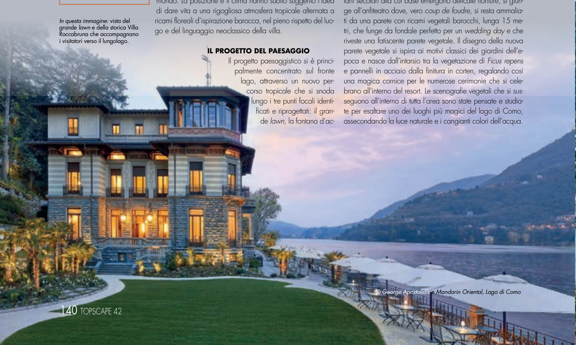
© George Apostolidis e Mandarin Oriental, Lago di Como